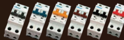
Llaves termomagnéticas 2 polos E2C16 / E2C20 / E2C25 / E2C32 / E2C40 / E2C63 caja x 6 unds