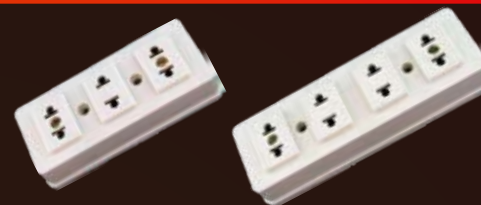
Tomacorriente económico 3 entradas / 4 entradas ECTO3AR / ECTO4AR paquete x 20 / 12 unds