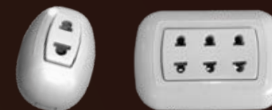
Línea Visible Toma simple / triple visible blanco VB012BL / VB013BL caja x 50 / 20 unds