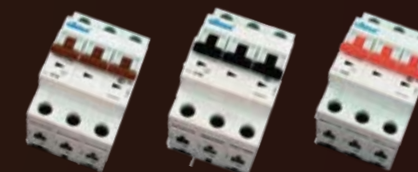
Llaves termomagnéticas 3 polos E3C32 / E3C40 / E3C63 caja x 4 unds